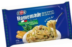
菠菜忌廉雞肉闊條麵