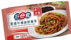
黑椒牛柳絲炒烏冬