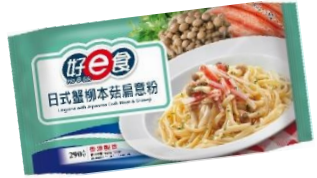
日式蟹柳本菇扁意粉