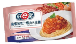
龍蝦風味汁蝦肉天使麵