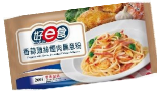
香蒜雞絲煙肉扁意粉