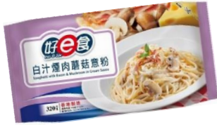
白汁煙肉蘑菇意粉